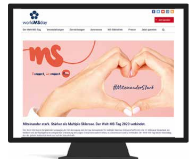
Die Website zum Welt-MS-Tag: www.weltmstag.at